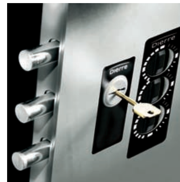
ARMADIO CHIAVE CON COMBINATORE